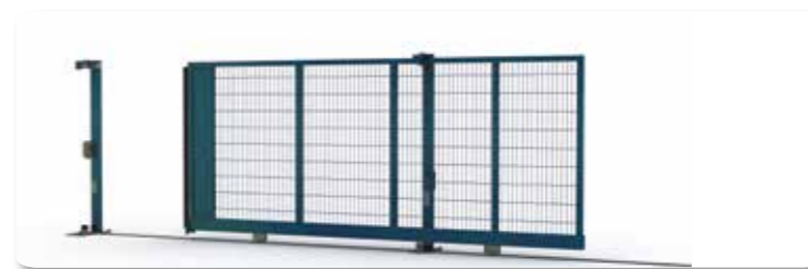
Passage 5 m - Hauteur 2,20 m - Fonctionnement manuel