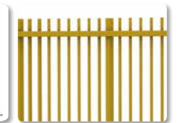
Remplissage barreaux carrés dépassants

Passage 6 m - Hauteur 2 m - Fonctionnement motorisé