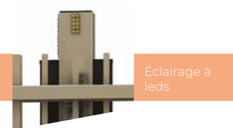
Éclairage à leds

Le portail coulissant de la gamme STANDARD est proposé dans plusieurs remplissages différents pour apporter une parfaite harmonie avec la clôture. Il est disponible jusqu'à 12 m de passage et 2,50 m de hauteur.