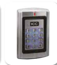
Digicode/lecteur de proximité