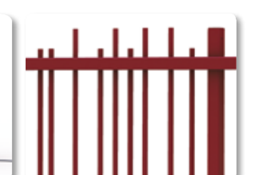
Remplissage EXALT® ORIGIN