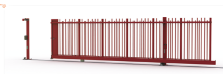
Passage 7 m - Hauteur 2 m - Fonctionnement manuel