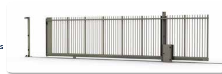
Passage 9 m - Hauteur 2,50 m - Fonctionnement motorisé - Option armoire technique