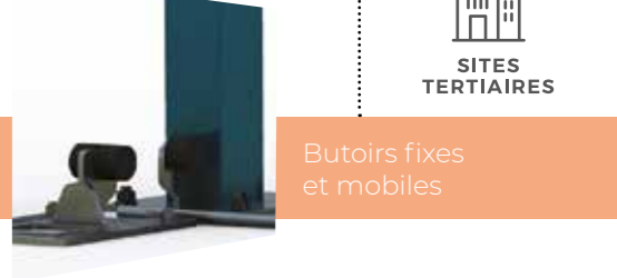
Butoirs fixes et mobiles