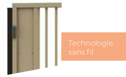
Technologie sans fil