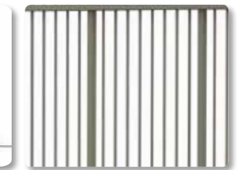
Remplissage barreaux ronds non dépassants