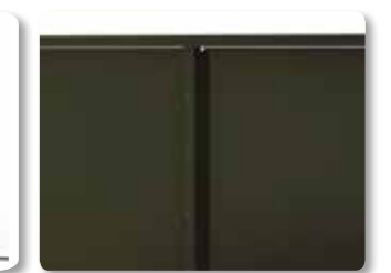
Remplissage tôle, vue intérieure