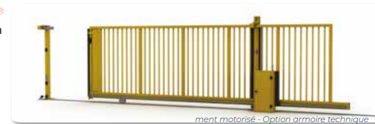
Passage 6 m - Hauteur 2 m - Fonctionnement motorisé - Option armoire technique