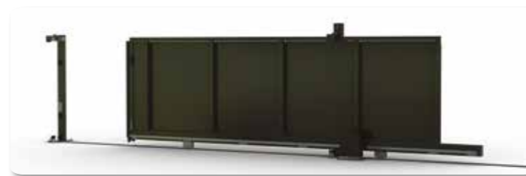
Passage 5 m - Hauteur 1,80 m - Fonctionnement motorisé